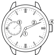
Часы на механизме Молния 3603