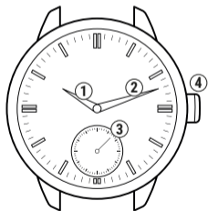
Часы на механизме Молния 3603 компоновка Savonnette